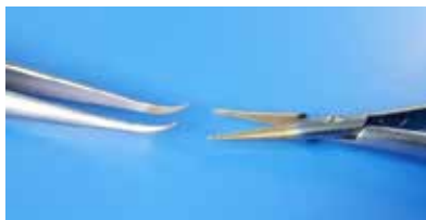
各種マイクロサージャリーに最適