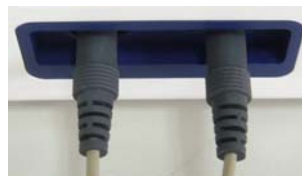
28mm 間隔の端子に接続