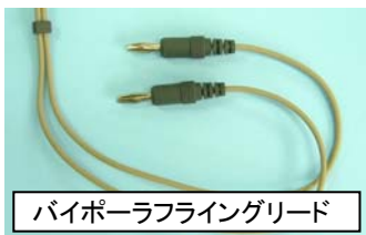
バイポーラフライングリード