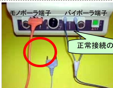
モノポーラ端子 バイポーラ端子